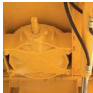
DAS HERZ DES MISCHERS

Gefederte und nachstellbare Rührarme garantieren bestes Mischgut bei wenig Verschleiß.