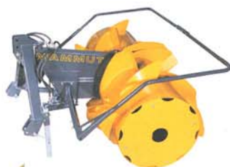
SF 205 Titan