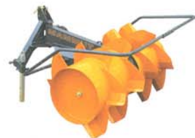
SF 175 HSB