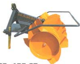
SF 175 ST