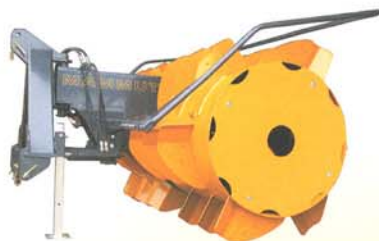
SF 230/280 Gigant