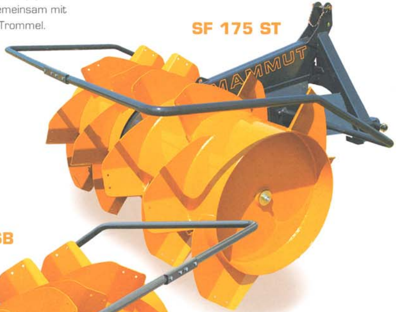
SF 175 ST